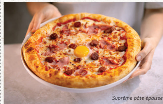
Suprême pâte épaisse

SUPRÊME 12€90 sauce tomate, mozzarella Fior di Latte, jambon blanc, merguez, lardons fumés, œuf plein air