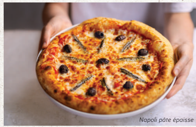
Napoli pâte épaisse

NAPOLI 11€90 sauce tomate, mozzarella Fior di Latte, anchois marinés, olives de Kalamata