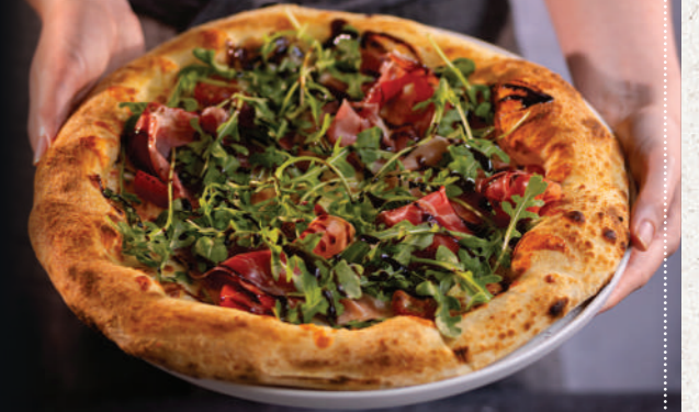
La Serrano pâte épaisse

MORTABELLA 13€90 sauce tomate, mozzarella Fior di Latte, mortadelle, burrata fondante à cœur, roquette, pistaches grillées