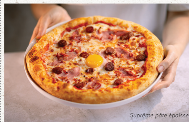
Suprême pâte épaisse

SUPRÊME 11€90 sauce tomate, mozzarella Fior di Latte, jambon blanc, merguez, lardons fumés, œuf plein air 🇫🇷