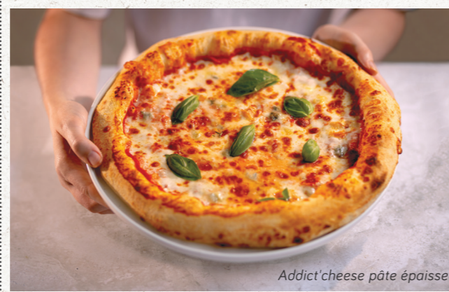
Addict'cheese pâte épaisse

ADDICT'CHEESE 11€90 sauce tomate, mozzarella Fior di Latte, taleggio AOP, gorgonzola AOP, basilic frais